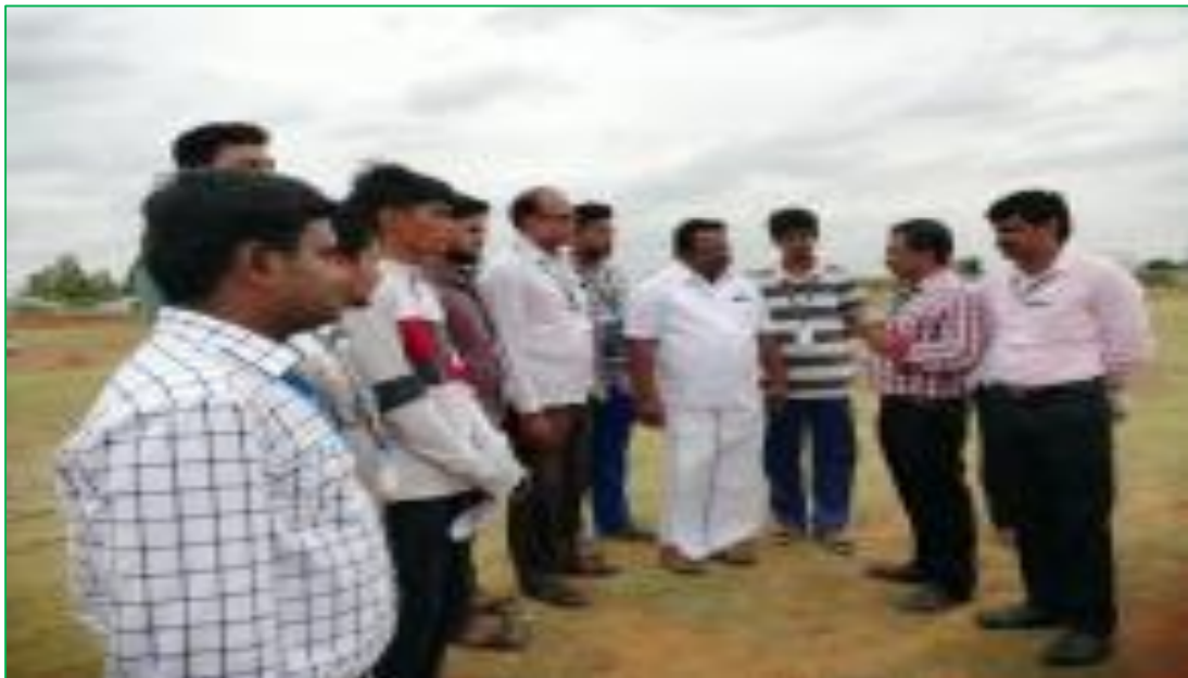
Our club members actively participated in dredging the Pond at K. Sathanur ,K.K.Nagar Trichy on 05.8.2019