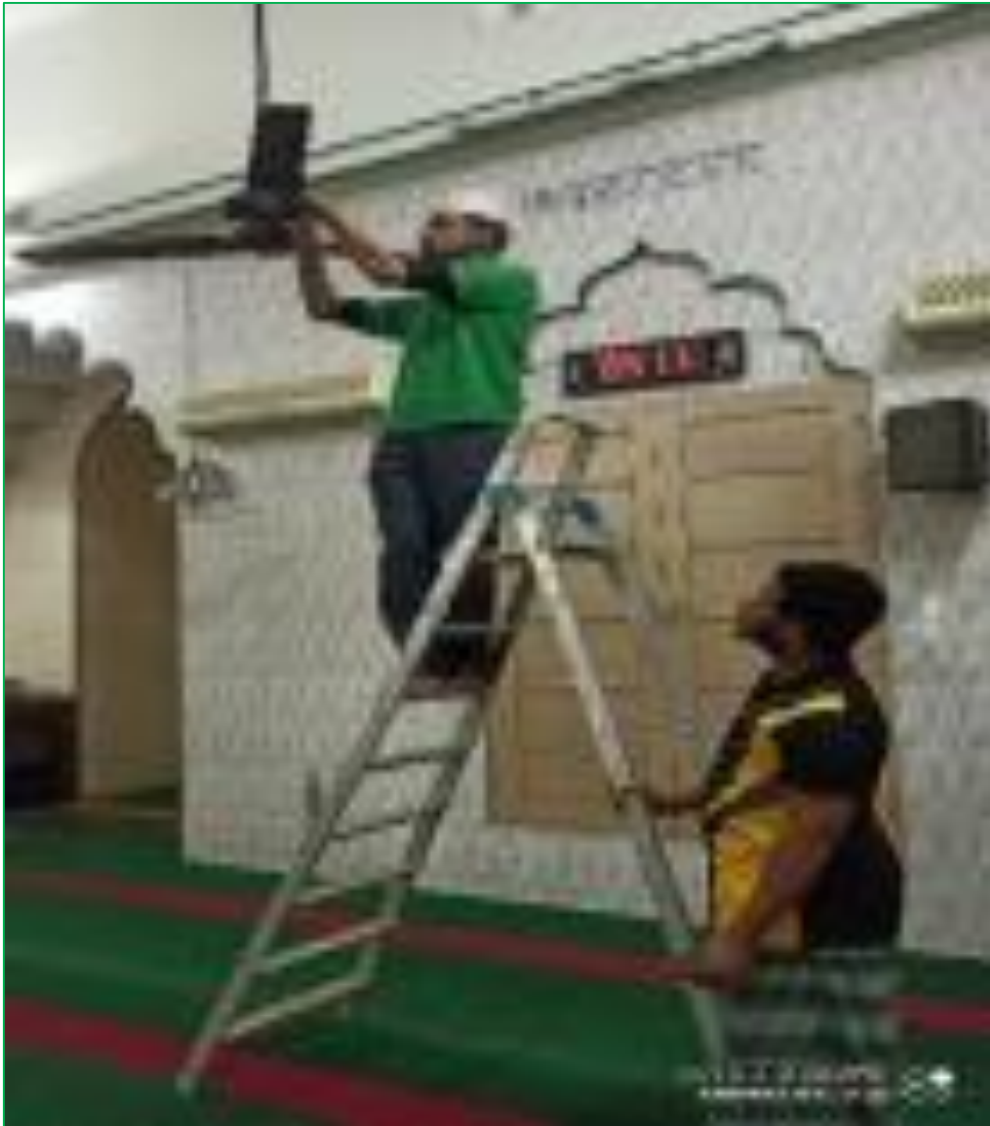
Cleaning work done at college masjid on 25.01.2020