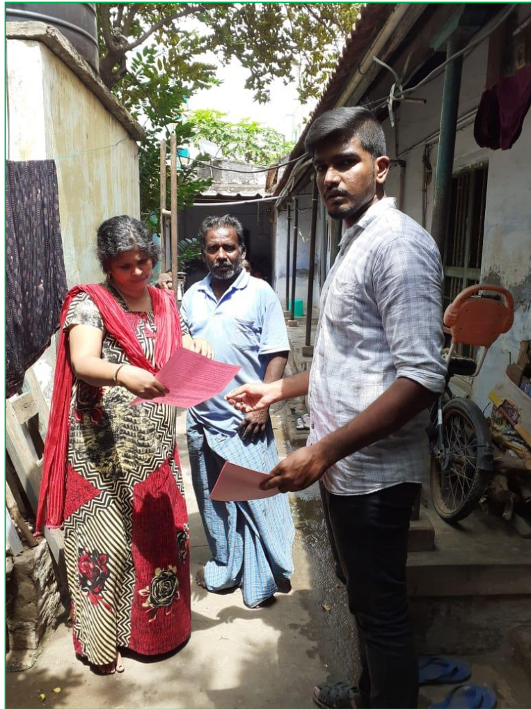
Our club Members gave dengue awareness pamphlets in city corporation areas on 18.10.2019