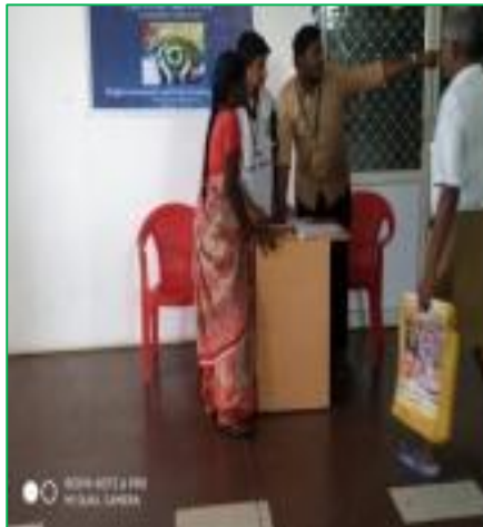
HELPING DESK INSTALLATION Government Hospital, Trichy, Our Club Members Clarified and guided the Out Patients on 28.08.2019 – 17.10.2019