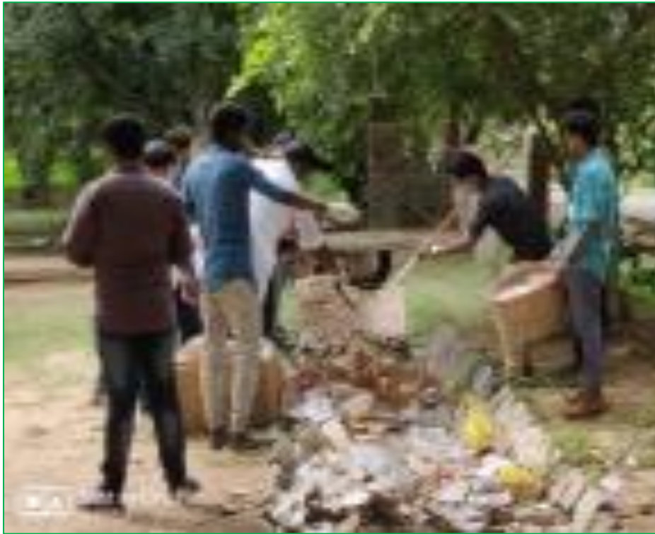
Cleaning work done at OFT Market on 21.09.2019.