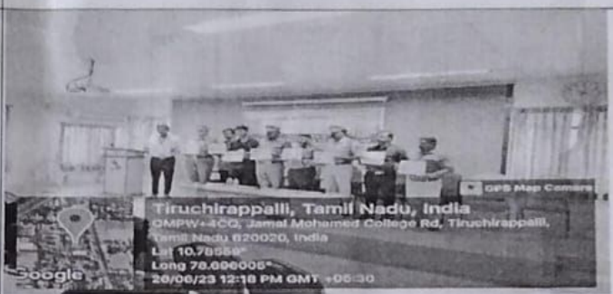
Chief guests, Part v Coordinator, staff advisors and students displays the SOS Police Helpline APP.