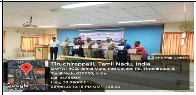
Chief guests , Part v Coordinator,staff advisors and students displays the SOS Police Helpline APP.