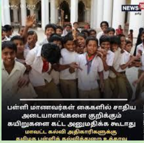
பள்ளி மாணவர்கள் கைகளில் சாதிய அடையாளங்களை குறிக்கும் கயிறுகளை கட்ட அனுமதிக்க சுவடாது மாவட்ட கல்வி அதிகாரிகளுக்கு வழியாக பள்ளிக் கல்விக்கணை உக்காவு