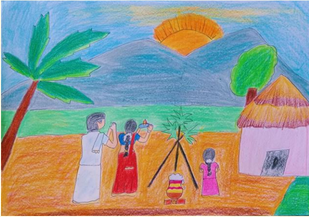
இர்பானது ஸஹ்தியா, இளங்கலை இரண்டாண்டி.