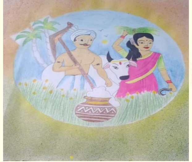
த.மோகனதாரன், இளங்கலை இரண்டாண்டி.