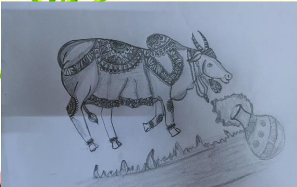
அ.அஜ்முன்ஷா, இளங்கலை இரண்டாண்டி.